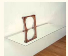
José Pedro Croft Sem título, 1995 Madeira, espelho. 42 x 90 x 63 cm Col. Peter Meeker, em depósito na Fundação de Serralves – Museu de Arte Contemporânea, Porto Depósito em 2000