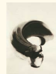
Gabriel Orozco* Sem título , 2002 Guache sobre papel. 30,5 x 23 cm Col. Desenhos da Madeira, em depósito na Fundação de Serralves – Museu de Arte Contemporânea, Porto. Depósito em 2011