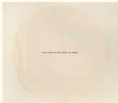
James Lee Byars A White Paper Will Blow Through the Street, 1967 Papel circular dobrado em forma de sobrescrito. Ø 68 cm Col. Fundação de Serralves – Museu de Arte Contemporânea, Porto. Aquisição em 2002