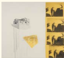
Julião Sarmento* Estoril yellow plants , 2013 Acetato polivinílico, pigmentos, esmalte aquoso, gesso acrílico, tinta acrílica, grafite e serigrafia sobre tela de algodão não preparada. 197 x 222 x 6,5 cm Col. Fundação de Serralves – Museu de Arte Contemporânea, Porto. Aquisição em 2016