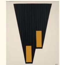
Joaquim Bravo* Série "Sul Americanos" nº 2, 1988 Tinta acrílica sobre tela. 120 x 99,5 cm Col. Ivo Martins, em depósito na Fundação de Serralves – Museu de Arte Contemporânea, Porto. Depósito em 1995