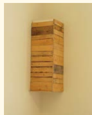
Pedro Cabrita Reis A palavra inacabada (Uma luz interdita I) , 1992 Madeira, vidro e gesso. 120 x 56 x 58 cm Col. privada, em depósito na Fundação de Serralves – Museu de Arte Contemporânea, Porto. Depósito em 1998