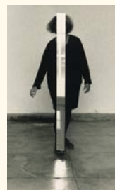
Helena Almeida* Dentro de mim , 2001 Fotografia p/b. 232 x 120 cm Col. Fundação Luso-Americana para o Desenvolvimento, em depósito na Fundação de Serralves – Museu de Arte Contemporânea, Porto