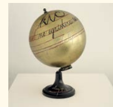
Dimitrije Bašičević Mangelos Skica za manifest o kicu, 1977-78 Folha de ouro e tinta acrílica sobre plástico, metal. 38 x Ø 26 cm Col. Fundação de Serralves – Museu de Arte Contemporânea, Porto. Aquisição em 2006