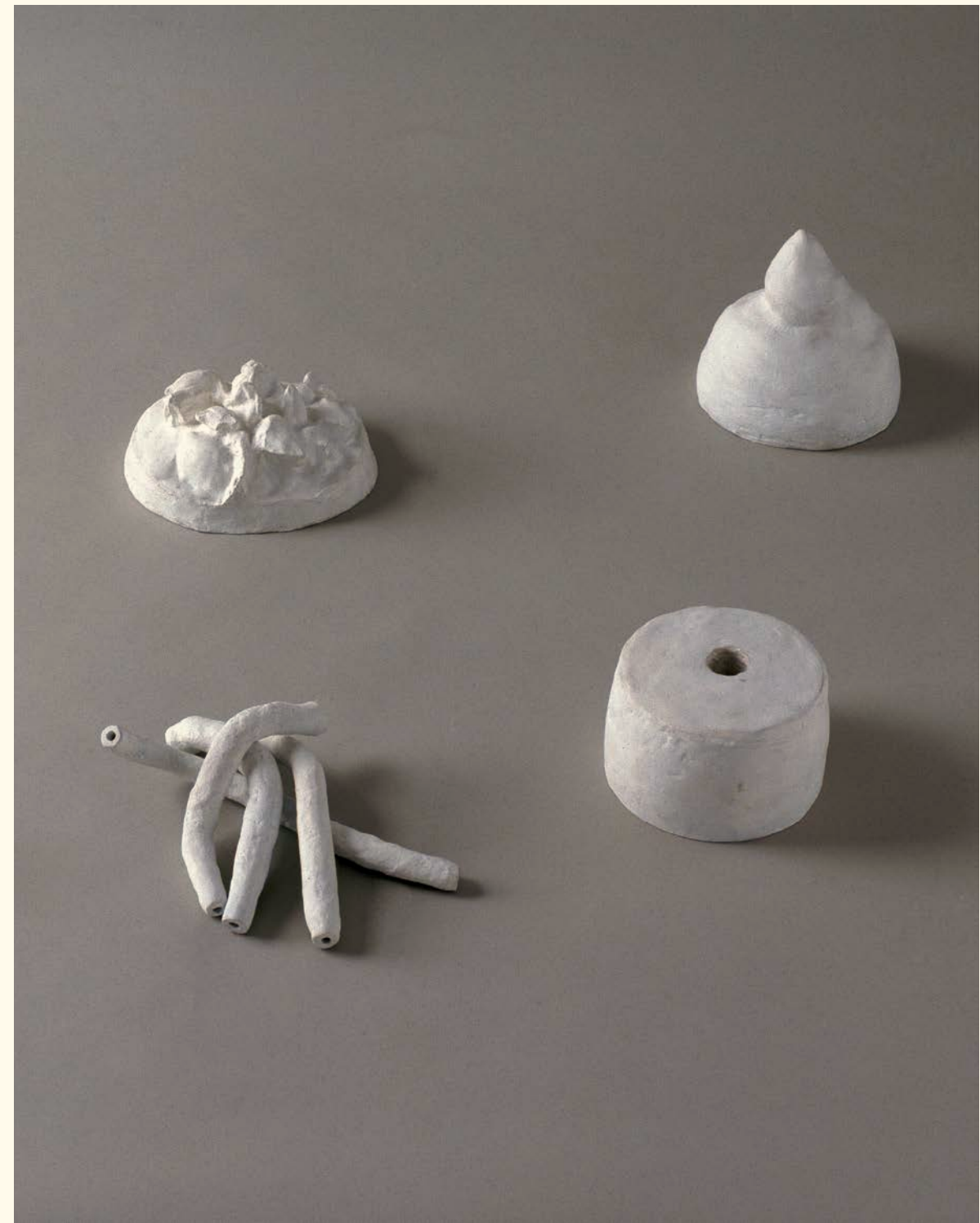
Ana Jotta Sem título , 1990