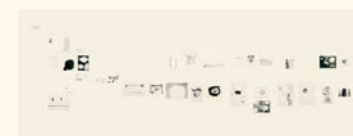
Silvia Bächli Solilja , 2003 Guache, tinta-da-china, pastel de óleo, lápis e carvão sobre papel, fotografia (34 elementos). 238 x 828 cm Col. Fundação de Serralves – Museu de Arte Contemporânea, Porto. Aquisição em 2007