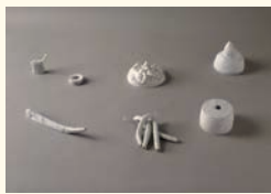
Ana Jotta 7 obras Sem título , 1990 Bronze pintado. 5,5 x 36 x 4,5 cm; 2,5 x 8 x 7 cm; 8,5 x 28 x 20 cm; 9,5 x 20,5 x 17 cm; 10 x 16 x 16 cm, 12 x 6,5 x 3 cm; 10 x 16 x 16 cm Col. Fundação Luso-Americana para o Desenvolvimento, em depósito na Fundação de Serralves – Museu de Arte Contemporânea, Porto. Depósito em 2002