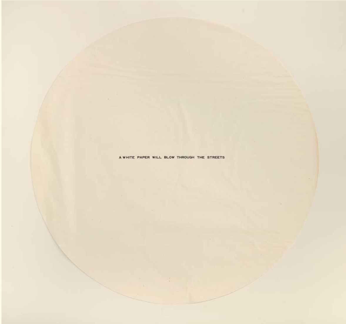
James Lee Byars A White Paper Will Blow Through the Street, 1967