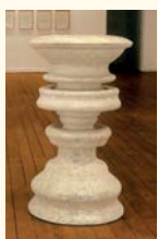
Joel Fisher Sem título , n.d. Calcário. 100 x 60 x 60 cm Col. Fundação Luso-Americana para o Desenvolvimento, em depósito na Fundação de Serralves – Museu de Arte Contemporânea, Porto. Depósito em 2000