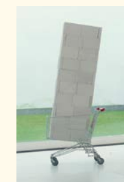
Marcelo Cidade Imóvel , 2004 Carrinho de supermercado, tijolos de cimento. 190 x 55 x 100 cm Col. P. O. P., em depósito na Fundação de Serralves – Museu de Arte Contemporânea, Porto. Depósito em 2010