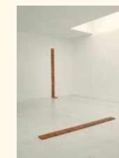
Leonor Antunes "paving stones across the garden" , 2008 Couro (2 elementos). Ed. 2 + 1 P.A. Dimensões variáveis Col. Fundação de Serralves – Museu de Arte Contemporânea, Porto. Aquisição em 2013