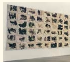
João Queiroz Sem título (da série “O ecrã no peito”), 1999 Carvão sobre papel (60 elementos) 35 x 50 cm (cada) Col. Fundação Luso-Americana para o Desenvolvimento, em depósito na Fundação de Serralves – Museu de Arte Contemporânea, Porto. Depósito em 2004