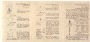
Alberto Carneiro Árvore / Escultura viva (projecto), 1972 Grafite sobre papel milimétrico. 29,5 x 21 cm (cada) Col. Fundação Luso-Americana para o Desenvolvimento, em depósito na Fundação de Serralves – Museu de Arte Contemporânea, Porto Depósito em 1990