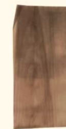
Gabriel Orozco* Sem título (Círculos e rayas) , 2003 Impressão sobre folha de madeira. 29 x 15,5 cm Col. Desenhos da Madeira, em depósito na Fundação de Serralves – Museu de Arte Contemporânea, Porto. Depósito em 2011