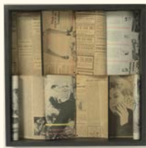
Alberto Carneiro A-Z Comunicações, 1971 Papel, madeira. 50 x 50 x 10 cm Col. Fundação Luso-Americana para o Desenvolvimento, em depósito na Fundação de Serralves – Museu de Arte Contemporânea, Porto. Depósito em 1999