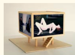
Alicia Framis Billboard Thailandhouse , 2001 Madeira, tecido, fotografia, a cores. Ed. 2/5. 35,8 x 51,7 x 56,9 cm Col. Fundação de Serralves – Museu de Arte Contemporânea, Porto. Aquisição em 2006