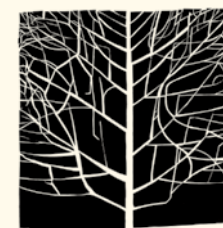
Ana Jotta Monoparental Uma , 2002 Feltro recortado e entretela. 156 x 153 cm Col. Fundação Luso-Americana para o Desenvolvimento, em depósito na Fundação de Serralves – Museu de Arte Contemporânea, Porto