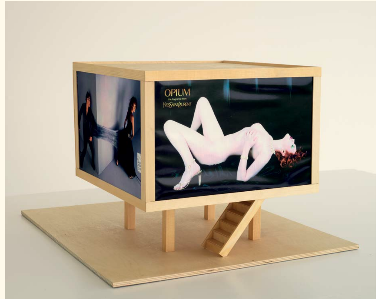
Alicia Framis Billboard Thailandhouse , 2001

As part of a continued research and development of the Collection in the twenty-first century, the Serralves Collection aspires to further distinguish itself through its focus on contemporary art's relationship to performance, architecture and contemporaneity in relation to a post-colonial and globalized present. While resonating with the art and ideas of our recent past, the Collection aims to reflect on how the art of today also anticipates its future.