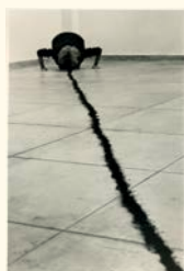
Helena Almeida Dentro de mim , 1998 Fotografia p/b. 185 x 122 cm Col. Fundação Luso-Americana para o Desenvolvimento, em depósito na Fundação de Serralves – Museu de Arte Contemporânea, Porto