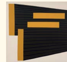
Joaquim Bravo* Série "Sul Americanos" nº 4, 1988 Tinta acrílica sobre tela. 110 x 115 cm Col. Ivo Martins, em depósito na Fundação de Serralves – Museu de Arte Contemporânea, Porto. Depósito em 1994