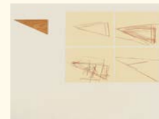
Blinky Palermo Happier than the Morning Sun "To Stevie Wonder", 1975 Contraplacado (1 elemento), litografias sobre papel Butten (4 elementos). Ed. 9/20. 125 x 255 cm Col. Fundação de Serralves – Museu de Arte Contemporânea, Porto. Aquisição em 1999